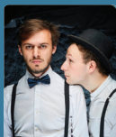
Guigue & Plo